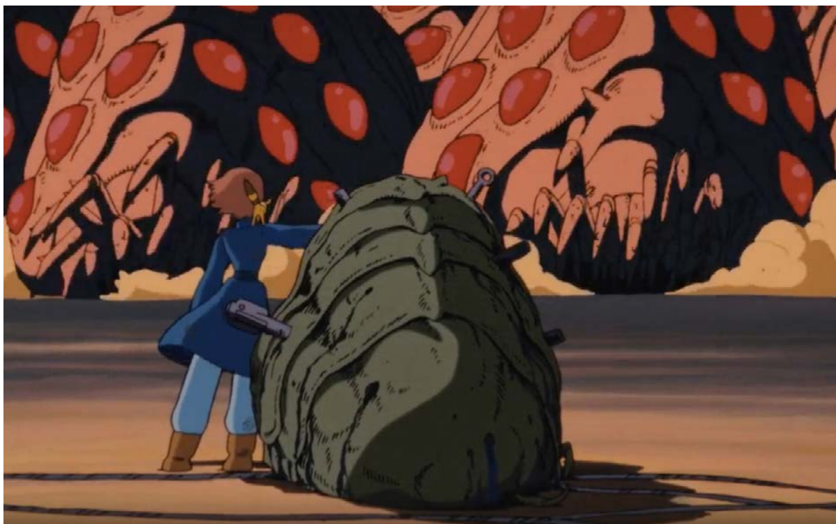
Девочка и ом стоят перед толпой бегущих омов

военные действия по захвату территорий и уничтожению населения соседних стран, в том числе, сбрасывает на соседние государства биологическое оружие, отравляет воду в колодцах Китая, население которого мучительно гибнет от привнесенных болезней еще долгие годы после окончания войны.