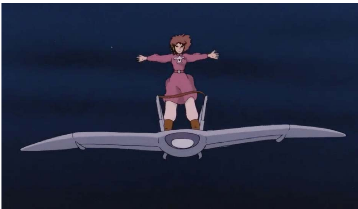
Девочка с раскинутыми руками

Вторая мировая война. Японская Империя, объединившись с фашистскими Германией и Италией, активно ведет