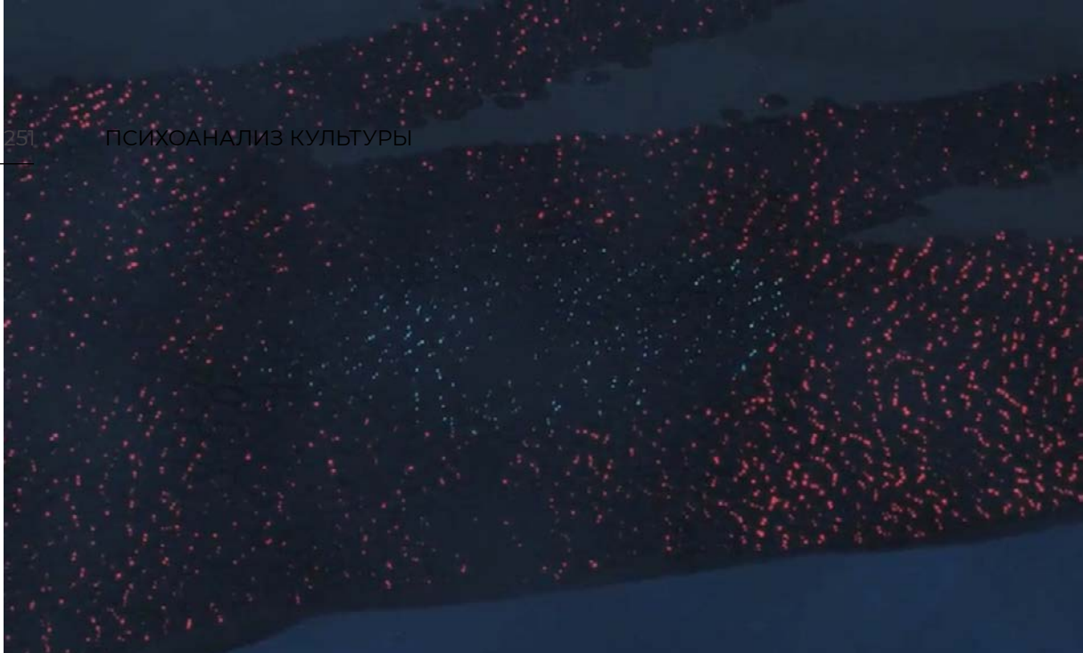
Ярость гаснет (синее пятно в центре красного)

Хаяо Миядзаки ищет его и пытается показать нам.